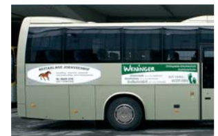
Seitenflächenmodul Format: ca. 180x55 cm Always on the right side