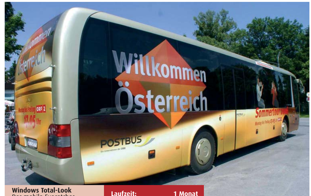
Windows Total-Look Der mobile Eyecatcher und Werbestar