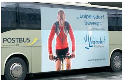
Traffic Board Format: ca. 430x200 cm Das Plakat auf dem Bus