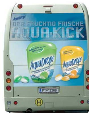
Jumbo Heck Format: ca. 215x200 cm Der Riese unter den Heckflächen