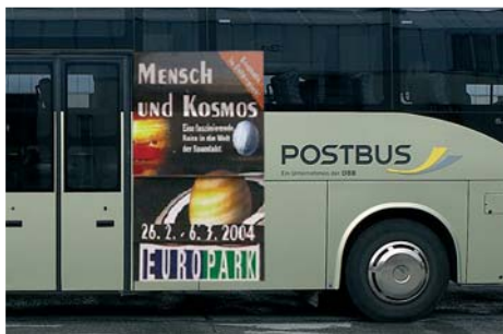
Traffic Board Junior Format: ca. 115x170 cm Verkehrsmittelwerbung im City Light-Format