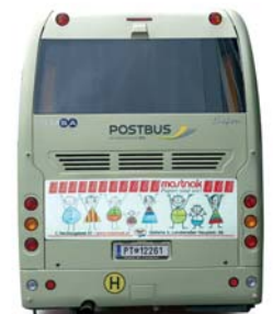
Heckfläche "Classic" Format: ca. 215x95 cm Aufmerksamkeit on top

Laufzeit: min. 1 Monat Euro/Monat: 175,-