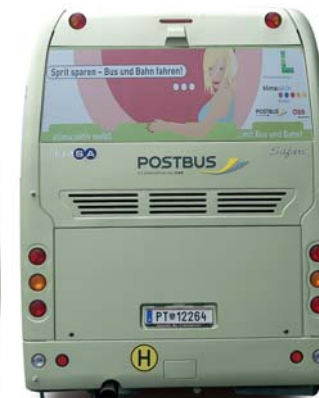
Heckfläche "Win" Format: ca. 215x68 cm Ein Fenster für die Werbung

Laufzeit: min. 1 Monat Euro/Monat: 175,-